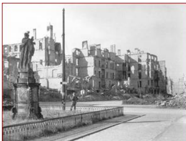
Róg ulicy Dobrzyńskiej tuż po wojnie

1945 rok - W czasie obrony Festung Breslau mieści się tu punkt segregacyjno-opatrunkowy. Zniszczeniu uległy wszystkie budynki ulicy, prócz kościoła i stojącego po drugiej stronie ulicy budynku Kasy Chorych. Po wojnie budynek uszkodzony i wypalony przejęty przez polską służbę zdrowia, a ulicę nazwano Dobrzyńską.